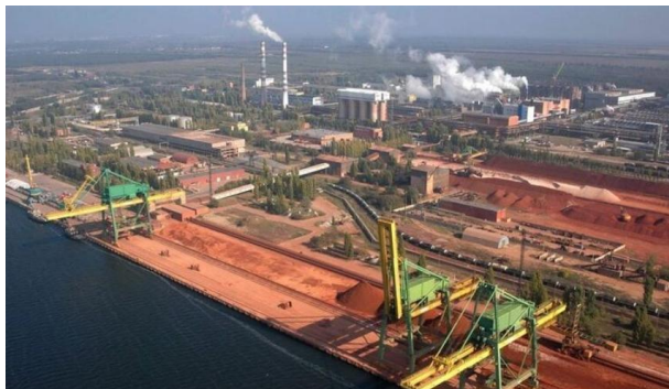
Миколаївський глиноземний завод